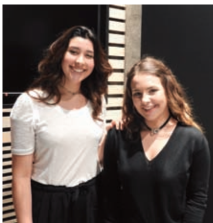
Quelques participants à cette soirée.