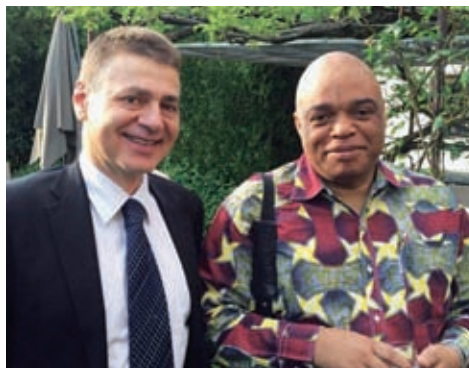
Quelques représentants du comité de la SGUP.