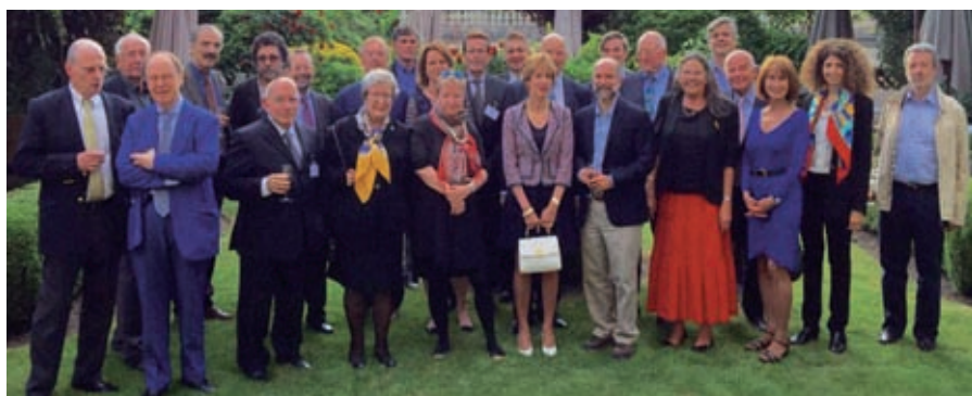
Les conférenciers avec quelques représentants de la SGUP.