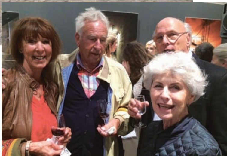
Quelques autres participants de la soirée.