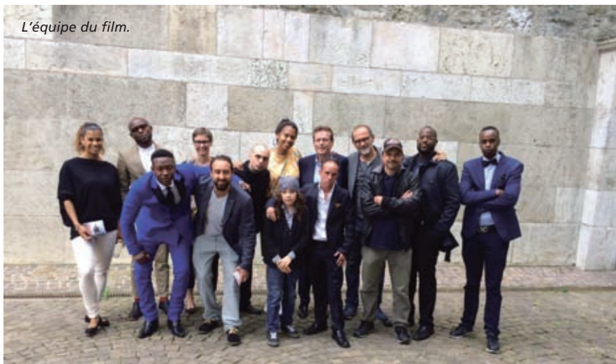
L'équipe du film.