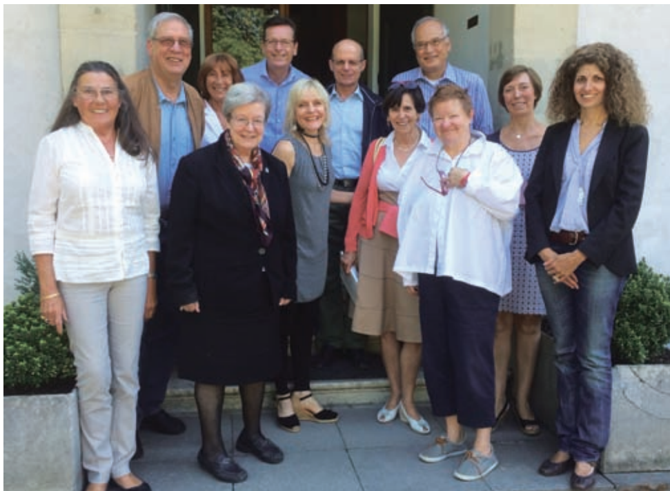
Le comité 2015- 2016.